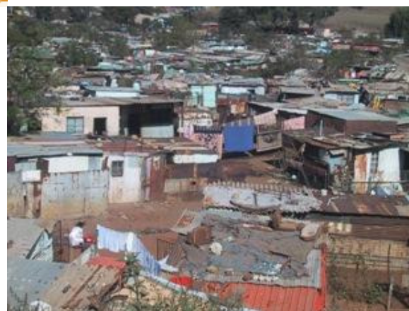
Une vue de Soweto

La dérive totalitaire du régime s'inscrit également dans le contexte de la guerre froide. La politique répressive vise à supprimer le communisme et toute activité d'opposition, incitant « à l'agitation ou au désordre », en Afrique du Sud. Des réunions sont interdites. Des « suspects » sont assignés à résidence. La loi sur le terrorisme de 1967 autorise les officiers de police, de rang au moins égal à celui de lieutenant-colonel, à détenir et à interroger toute personne suspecte. Le pouvoir utilise fréquemment des mesures d'urgence qui multiplient les détentions arbitraires et la pratique avérée de la torture.