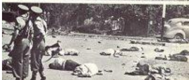
Une soixantaine de personnes furent tuées & agrave; Sharpeville en 1960

Expropriation, exploitation, discrimination : la jeune Union sud-africaine porte les stigmates de la colonisation. Si les Historiens s'accordent généralement pour situer les racines du mal dans la période coloniale, la responsabilité des Afrikaners dans la naissance de l'Apartheid reste controversée.