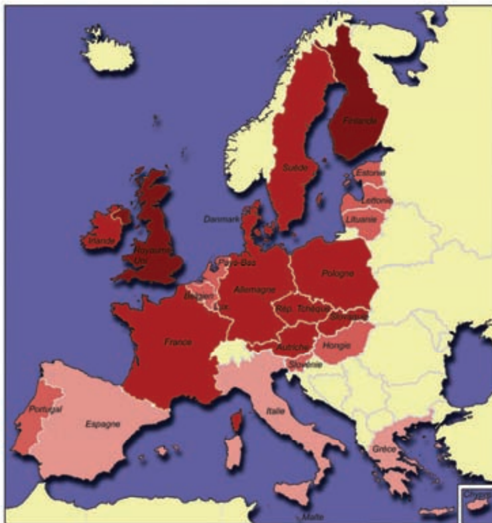
Graphique 2: Statut des mécanismes officiels de collecte de données judiciaires sur la criminalité et la violence raciste 2004 - 2005