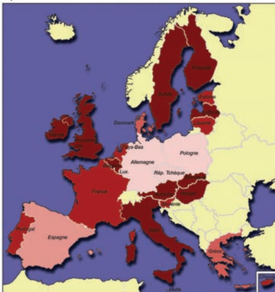
Graphique 1: Organismes spécialisés dans la promotion de l'égalité de traitement en place vers la fin de 2005